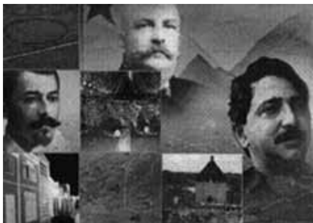
Figura 02 – Capa do Livro Temático: Cultural Político do ZEE

No que diz respeito aos heróis, do primeiro evento foram escolhidos Luiz Galvez e Plácido de Castro: o primeiro pela criação do Estado Independente do Acre (1889) e pelo discurso fundador do Acre; e Plácido de Castro é aquele que organizou um exército de seringueiros e ganhou a guerra, em sua fase “sangrenta” da denominada “Revolução Acreana” (1902-1903). Do Movimento Autonomista foi escolhido José Guiomard dos Santos, autor do Projeto de Lei que criou o Estado do Acre. E do movimento seringueiro foi escolhido Chico Mendes. Estes heróis servem, por exemplo, para ilustrar documentos oficiais do governo, como este da figura 02, onde figuram Plácido de Castro, Luiz Galvez e Chico Mendes.