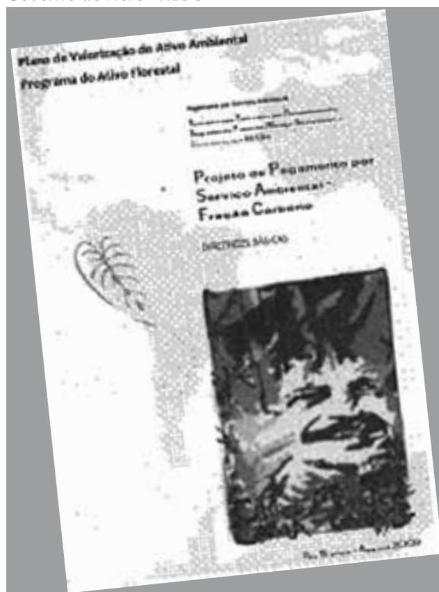
Figura 01 – Capa de uma das Políticas do Governo do Acre - REDD

A questão identitária, enquanto bandeira de propaganda política no Acre, já estava posta pelo grupo que formaria mais tarde a FPA, desde a campanha eleitoral para governo estadual de 1990. O que significa dizer que a questão da apropriação e ressignificação dos “sonhos e ideais” de